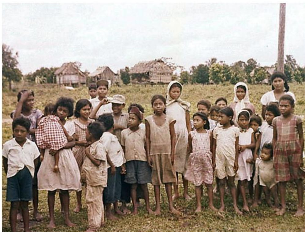
Niños Ulwas de Río Coco. Colección William M. Denevan 1957. Karl Offen, Photo Tour of the Mosquitia

La Dra. Levy renunció como Coordinadora del programa de salud de Moravia