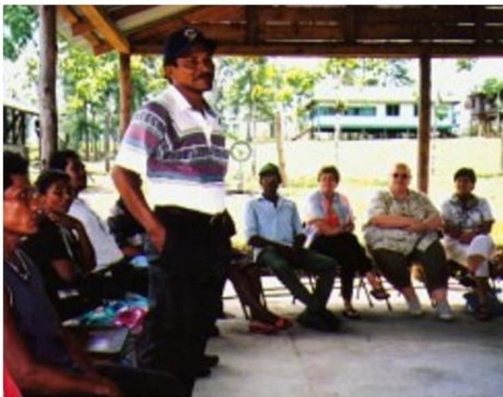
Un remanente, con la Iglesia Morava Bilwaskarma al fondo

Desde entonces hasta mediados de los noventa permaneció como una ruina silenciosa.